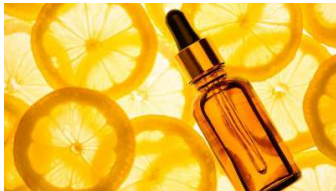
Limón, un aceite esencial que te devuelve la energía vital