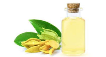
Aceite esencial de Ylang Ylang: 10 beneficios comprobados