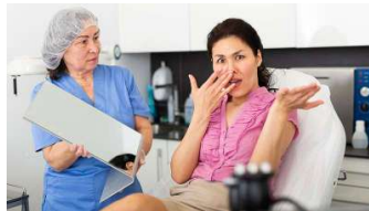
Salones de belleza: 10 formas de calmar a un cliente descontento