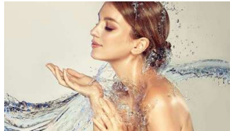
Pioneros 'beauty': los cosméticos que no necesitan agua para sobrevivir ('waterless')