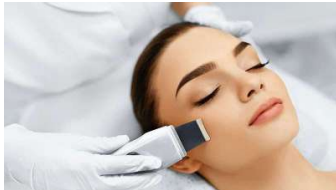
La nueva ley de aparatología avanzada en los centros de estética